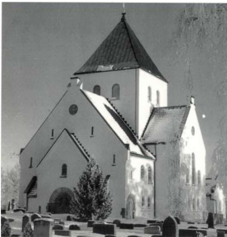
Ås kirke - se artikkel s. 112

Nr. 2 1996 Årgang 14 Pris kr. 40,- ISSN: 0802-860